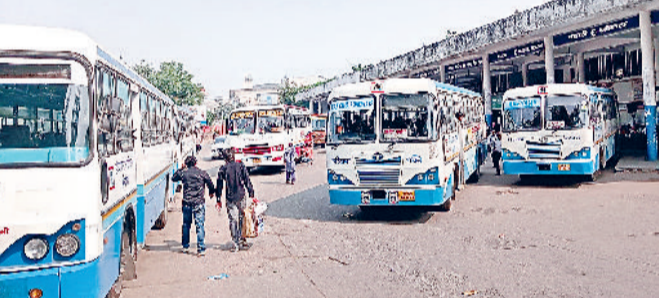
सोनीपत। सोनीपत बस अड्डा पर खड़ी रोडवेज व बीच में किलोमीटर के हिसाब से चलने वाली निजी बस।