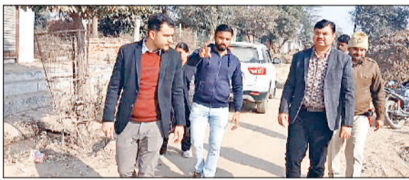
खरखोदा। सीवरेज व्यवस्था का निरीक्षण करते एसडीएम।