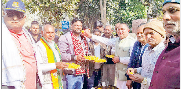
खरखोदा। एक दूसरे को लड्डू खिलाकर खुशी मनाते भाजपा कार्यकर्ता।