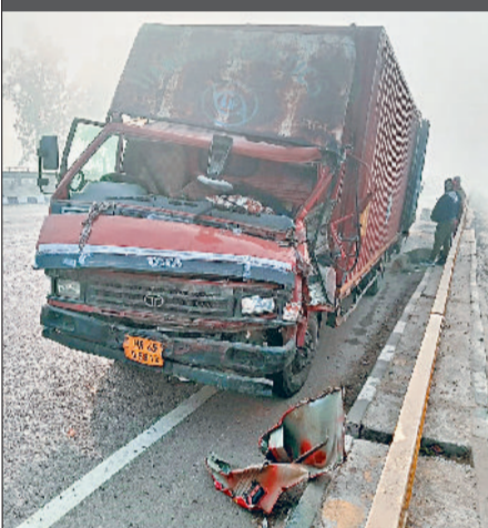
गन्नीर। वाहनों के टकराने से क्षतिग्रस्त कैटर।