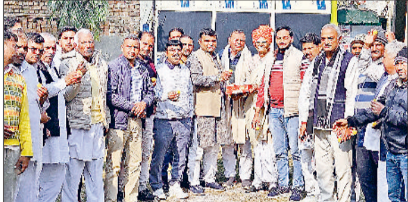
गोहाना। लड्डू बाँटते हुए भाजपा नेता और कार्यकर्ता।