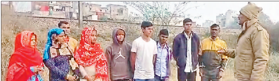
सोनीपत। रेल लाइन के साथ कॉलोनी में युवाओं व महिलाओं को ट्रेनों पर होने वाली पत्थरबाजी की घटनाओं को लेकर जागरूक करते आरपीएफ कर्मी।

रेलवे पुलिस बल (आरपीएफ) ने दिल्ली-अंबाला रूट पर सोनीपत क्षेत्र में ट्रेनों पर होने वाली पत्थरबाजी, रेल लाइन पर अलार्म चैन पुलिंग (एसीपी) जैसी घटनाओं पर अंकुश लगाने के लिए मंगलवार को ऑपरेशन दोस्ती के तहत जागरूकता अभियान चलाया। अभियान को लेकर आरपीएफ थाना