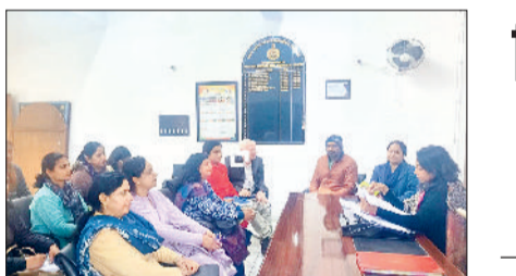
सोनीपत। डायट प्राचार्य ने खंड सहयोगियों के साथ की समीक्षा बैठक की।

नए बस अड्डे पर दोपहिया व चार पहिया वाहनों के लिए अलग-अलग पार्किंग की व्यवस्था किए जाने का प्रावधान रखा गया है। बस अड्डा परिसर में वाहन चालक अपनी-अपनी श्रेणी में वाहनों को खड़ा कर सकते हैं। इसके अलावा इलेक्ट्रिक बसों के लिए चार्जिंग स्टेशन बनाने की भी योजना है, ताकि यहां बसों को चार्ज कर लंबी दूरी सफर के लिए तैयार किया जा सके। कमर्शियल स्पेस से युक्त होगा नया भवन शहर से बाहर गांव जाट जोशी में बनने वाले बस अड्डे का नया भवन कमर्शियल स्पेस (व्यावसायिक सुविधा) से युक्त रहेगा। यहां यात्रियों की सुविधा के लिए दुकानों का निर्माण करवाया जाएगा। यात्री बस अड्डा परिसर में ही खाद्य पदार्थों संबंधी सामान की खरीदारी कर सकते हैं। इस योजना को नए भवन के डिजाइन में शामिल किया गया है। इसके रोजगार को भी बढ़ावा मिलेगा।