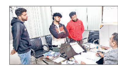
गोहाना। सुनवाई के लिए बुलाए गए लोगों से बातचीत करते हुए नप अधिकारी।

नगर परिषद द्वारा चलाए जा रहे आवारा कुत्तों को पकड़ने के अभियान का विरोध करना कुछ लोगों को अब भारी पड़ गया है। रविवार को नप की ओर से भेजी गई कुत्ता पकड़ने वाली टीम का जिन लोगों ने विरोध किया था, अब उन्होंने लोगों को अपने खर्च पर कुत्तों को छोड़कर आना होगा। नप प्रशासन ने सुप्रीम कोर्ट के आदेशों के तहत डाग शेल्टर बनाने की प्रक्रिया शुरू कर दी है। इसके साथ ही आवारा कुत्तों के पालन-पोषण के लिए सामाजिक संस्थाओं से सहयोग मांगा गया है। डॉग शेल्टर बनने के साथ शिक्षण संस्थानों, रेलवे स्टेशन, बस डिपो सहित अन्य