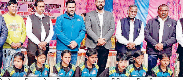
सोनीपत। विजेता खिलाड़ियों को सम्मानित करते हुए विधायक साथ में अन्य अतिथि एवं अधिकारी।