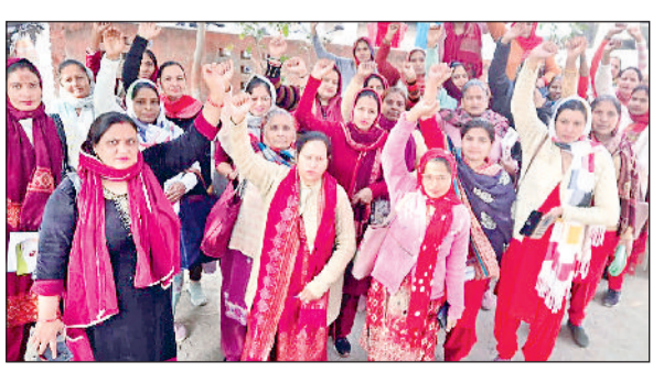
गन्नीर। ऑनलाइन काम के विरोध में आशा वर्कर्स प्रदर्शन करते हुए।